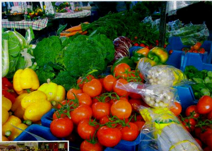
Der Fruchthof Berlin ist Lieferant für zahlreiche Wochenmärkte der Umgebung.

Erfahrungen besagen, solche Aktivitäten sollten nicht zu häufig durchgeführt werden, damit sie nicht verpuffen. Außerdem bekommen wir ja in diesem Jahr wieder eine Großbaustelle hier auf dem Gelände, weil der Blumengroßmarkt neu gebaut wird. Zur Eröffnung, das wird Anfang 2010 sein, bietet sich dann wieder an, einen Paukenschlag zu setzen und einen öffentlichkeitswirksamen Höhepunkt zu planen.