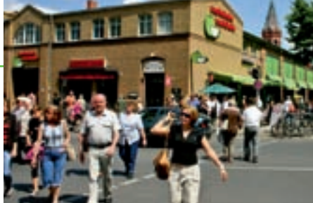
Die Marheineke Markthalle ist in 2013 wieder Schauplatz der GFI-Fructinale.

Für 2013 sind wir grundsätzlich optimistisch gestimmt. Trotz der erwähnten schwierigen Wettbewerbsbedingungen wie Preisdruck, Konzentration und Energieko-